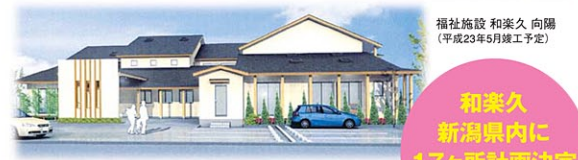
福祉施設 和楽久 向陽 (平成23年5月竣工予定)

入居者400~500人のスケールメリットを最大限に活かした、福祉・医療を通じた地域貢献。