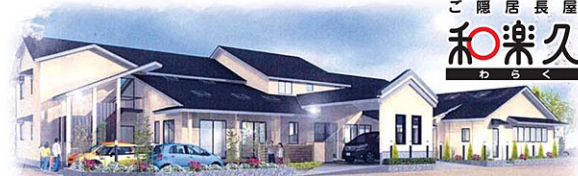
ご 隠 居 長 屋 和 楽 久 わ ら ぐ 福祉施設 和楽久 竹尾 (平成23年1月竣工)