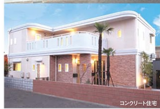
木造住宅 コンクリート住宅

無添加住宅 無添加住宅はアトピー、ぜんそく、アレルギーでお悩みの方にも安心して暮らせるように、人体に害を及ぼす可能性のある化学物質をとことん排除し、安全な住環境にこだわり、「食べられる」ほど安心な住まいです。